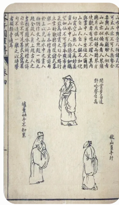
芥子园画传初集 -卷四卷端